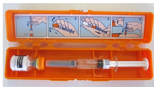
Figura 1. Glucagó

Si l'estat de consciència està alterat o no pot deglutir trucareu al 112/061 i administrareu ràpidament el glucagó intramuscular (figura 1) proporcionat pels pares/tutors i que ha estat conservat en nevera.